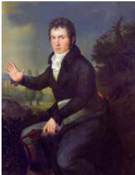
Beethoven hacia 1804, luciendo patillas jacobinas, retratado por Willibrod Joseph Maehler.

que subyugaba a la mayoría en beneficio de la aristocracia y el clero. El compositor, gran devoto de Napoleón en sus inicios, consideró seriamente mudarse al París de la Revolución, pero finalmente no abandonó la Viena imperial y llegó a ser investigado por la policía por sus ideas políticas. Beethoven se cuidó de manifestar públicamente su postura, pero, incluso cuando su fe por Napoleón decayó tras su autocoronación, nunca dejó de confiar en los ideales originarios de la Ilustración que llevaron a la instauración de un nuevo orden social y al reconocimiento de los derechos del individuo por encima de cualquier dictamen divino.